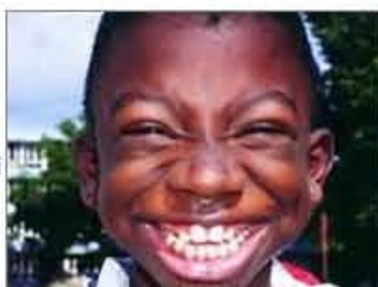
Nụ cười Habana

TTCN - Có một chiếc máy ảnh đã ghi lại hàng ngàn nụ cười của các dân tộc khác nhau trên thế giới, trong đó có trên 600 gương mặt VN. Đó là chiếc máy ảnh của đạo diễn người Nhật Mizutani Koji trong hành trình đi thu thập chân dung nụ cười.