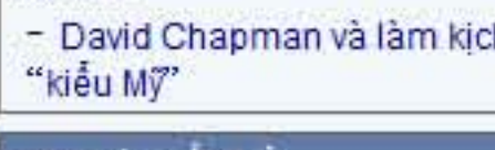
Thơ Hồ Huy Sơn