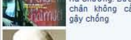
Lối đi mưa của Bi (Rain)