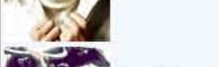
Ảnh nước trong Mưa len trâu