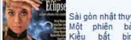
Sài Gòn nhất thực: Một phiên bản Kiều bất bình thường