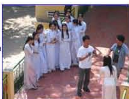
Đạo diễn Mizutani Koji đang chụp ảnh "nụ cười VN" tại trường PTTH Hùng Vương

Mỗi mặt người là một bông hoa. Khuôn mặt với nụ cười của những dân tộc khác nhau trên khắp thế giới chính là một thông điệp về hạnh phúc và niềm an lạc, góp phần xoa dịu niềm đau của thảm họa sóng thần vừa làm cả thế giới xót xa.