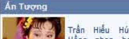
Nhạc sĩ khiêm thi Hà Chương: Bức chân không cần gây chống