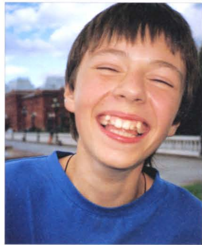
Намного на свете и друзей счастливее

公園で普段通りスケートボードをしていた少年です。彼の背後は閉鎖されたクレムリン。そしてこの公園も閉鎖されていたのですが、彼の笑顔とこの場面の対比が、作品の中に「明と暗」を生み出しています。そういった中からキラキラとした表現が生まれるのだと思います