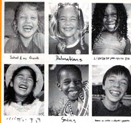
Merry Projectで撮られた世界の子供たちの笑顔、笑顔。

「笑顔は世界共通のコミュニケーション」を合言葉に、1999年からスタートした「Merry Project」。笑顔には未来を変える力があると、アートディレクターの水谷孝次氏が世界23カ国を歩き、「あなたにとってMerry(しあわせ)とは何ですか?」と問いかけ、撮り集めた2万人の笑顔の写真とメッセージ。Merryの輪を世界に広げていく壮大なコミュニケーションプロジェクトだ。