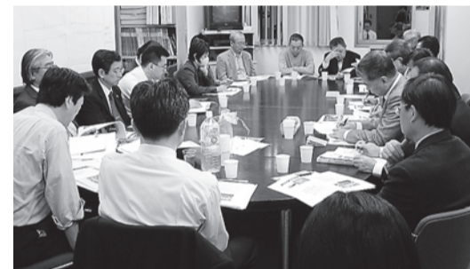
各部会での討議風景

【照会先】 緑政土木局道路管理課 ☎972-2849 FAX972-4167 中土木事務所 ☎261-6641 FAX252-0742