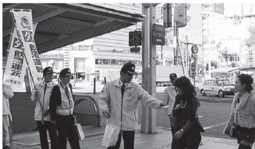
安心・安全で快適なまちづくり キャンペーン・なごや2007での活動

また、各部会では、魅力あふれるまちづくりについて検討し、安心・安全・快適でにぎわいのあるまちとするため、討議を進めています。