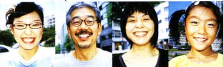
LIVEで、おしゃべり♪ 中区の魅力を伝えるために、おしゃべりイベントを開催しました。おしゃべりイベントで、おしゃべりイベントを開催しました。