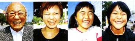
中区の私も、100歳。栄大村きくのひじりん華にのって、新卒就職がうれしかった！

平成20年、中区は100周年！あなたにとってMERRY(楽しいこと、幸せなとき、将来の夢)とは何ですか？