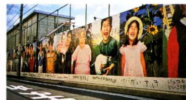
「Merry in KOBE 2002」では、神戸市新長田南再開発地区の工事現場の仮囲いに、アルミ板に出力した写真を掲出した。