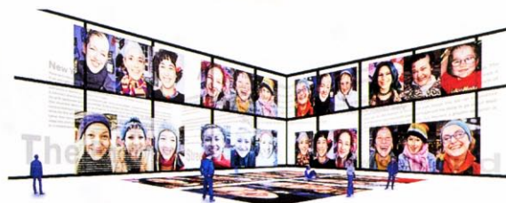
18:30～25:00まで、写真が床面や壁面にプロジェクターで映し出される。

展覧会に合わせて制作したフリーペーパーは、420×310mmオールカラー16ページの大判。ギャラリーに積み上げて展示する他、世界中に配布される。