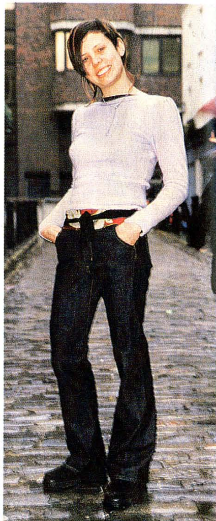
エヴィスジーンズやエドウィンなどは若者に根強い人気＝ロンドンで