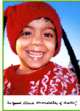
lo goud 5Goud chocolate of dulle! ワンちゃん、チョコレート、お人形 インド ムンバイ 3歳