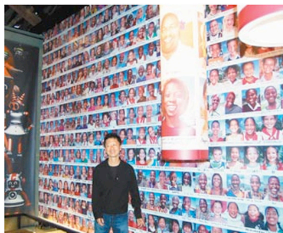
日本著名設計師水谷孝次昨天到福興穀倉，看到他曾在北京奧運讓大家驚豔的「微笑」作品，展示在有歷史味的穀倉，他直說「太棒了」。