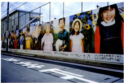
「Merry in KOBE 2002」(新長田南再開発工事仮囲い)。阪神淡路大震災から7年後の神戸を訪れて制作した、水谷の初のソーシャルワーク。商業主義から社会的・文化的なことへと意識が向かいだした最初の仕事だ