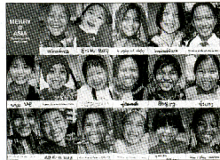
「MERRY」水谷孝次著(メリープロジェクト刊)1,680円(税込)

ジェクトの水谷孝次・アートディレクターが、心から楽しみを感じている瞬間の笑顔の世界に伝えるために奔走する様子を情熱的に語っている。笑顔とメッセージを見ていると、こちらも思わず微笑んでしまう幸せな空気を持った1冊だ。