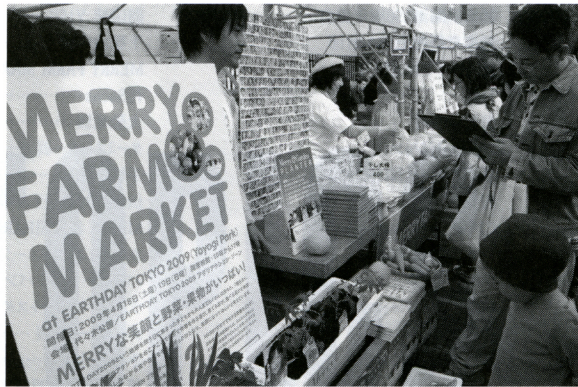
ブースでは、高知県や岐阜県から取り寄せた果物や野菜を販売↑↔

現在、事務所があるビルの屋上を農園にし、そこで世界23か国の米や野菜を育てました。そこに今回のプランターも持ってきて、経過をサイトで報告しながら、夏には収穫祭を行なおうと思っています（7月を予定）。一度のイベントだけで終わるのではなく収穫まで続くん다는こと。そういう意味では、今回初めて参加した人にとってはこれが始まりになるのです。