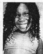
Li Be Da De pan pin pin Da