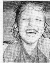
School & my friends

(幸せ)とは」という問いへの答えを書き添えた映像＝写真＝を、次々と投影する。また、世界各国の様々なデザインの段ボールを表紙に使った写真集を販売。南アフリカでの学校建設のため、売り上げの一部を寄付する。入場無料。03・3535・4611。