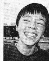
Amare na carina - playate ayya