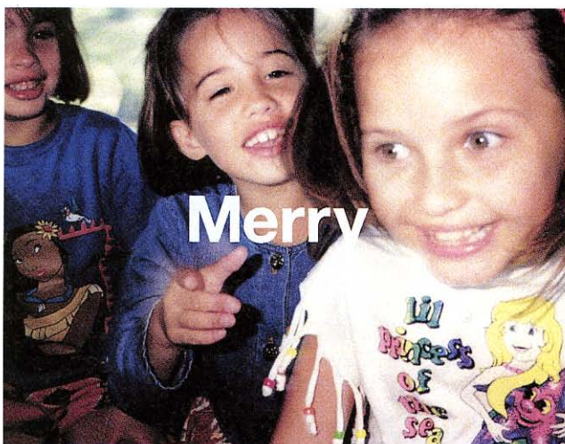
水谷孝次写真展「Merry～終わらないメリーゴーランド」

HOTなものからほっとするものまで、バラエティーにとんだ選りすぐりのトピックスを末広がりにも八つ紹介。2000年をいっそうミレニアムでメモリアルな年にするためにも、思いきって誰かを誘って出掛けてみよう。きっと楽しい時間が過ごせるはず！