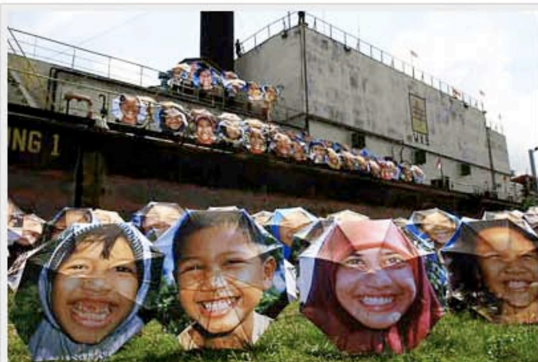
Seratus media payung anak-anak tersenyum dipamerkan di PLTD apung dalam rangka kreasi senyum anak dunia yang diprakarsai Merry Project dari Jepang.

Sunday, 08/11/2009 - 22:13 WIB - Oleh: [H!]Magazine