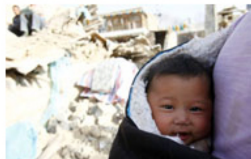
直面灾难 选择坚强